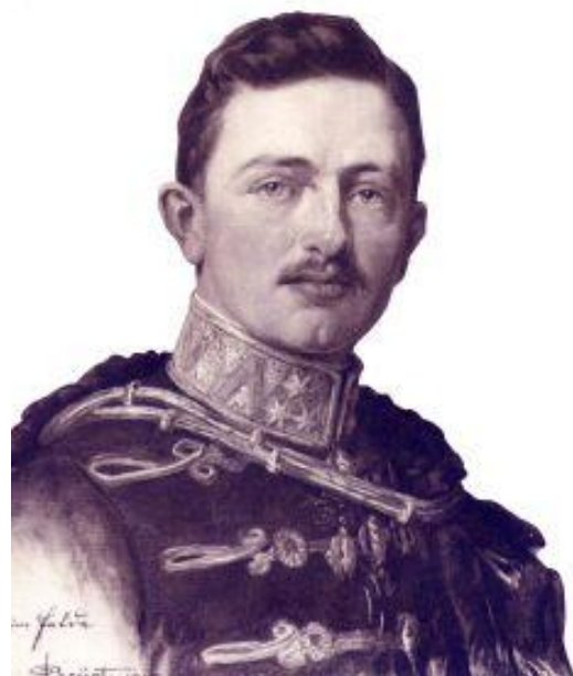
Boldog IV. Károly

Boldog IV. Károly! Imádkozz hazánkért, járj közben népünkért, hogy soha ne térjünk le arról az útról, amelyen az államalapításkor Szent István királyunk vezetésével elindultunk!