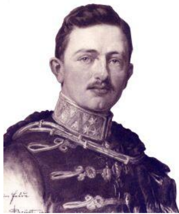
Boldog IV. Károly

Boldog IV. Károly! Imádkozz hazánkért, járj közben népünkért, hogy soha ne térrünk le arról az útról, amelyen az államalapításkor Szent István királyunk vezetésével elindultunk!