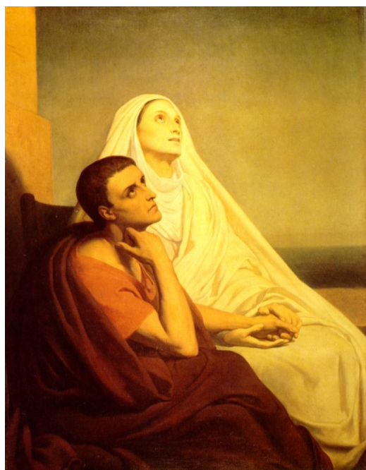
Szent Mónika és Szent Ágoston

Májusi számunkban a Szűzanyát ill. az édesanyákat szeretnénk központba állítani. Szent Mónika jól példázza a szentéletű édesanyákat, akik életáldozatukkal és életpéldájukkal előbb-utóbb elérik, hogy gyermekeik a helyes útra térjenek.